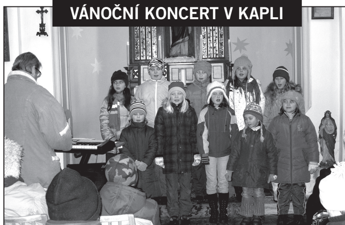
VÁNOČNÍ KONCERT V KAPLI